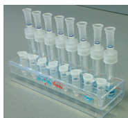
Zdjęcie poglądowe: umieszczenie kolumn i próbek odbieralnikowych w statywie Gravity flow.

4. Podczas inkubacji przygotować kolumny Micro AXD przez dokładne zamocowanie ich do próbek odbieralnikowych i umieszczenie w pozycji pionowej w statywie.